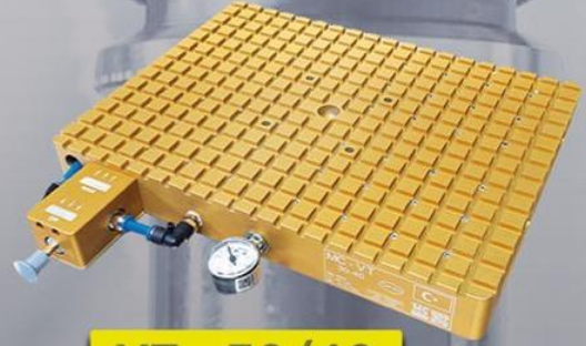
VT - 30/40