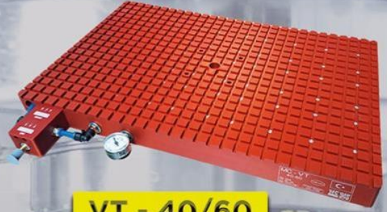
VT - 40/60