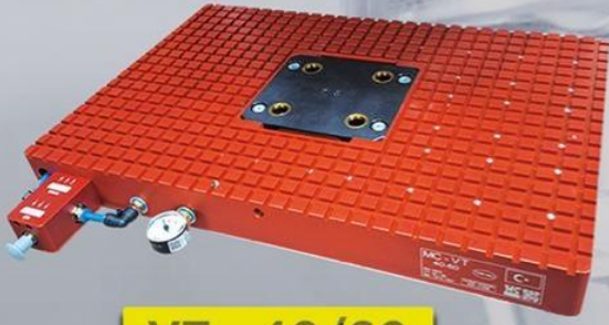
VT - 40/60 ZEROPOINT