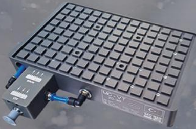
VT - 20/30